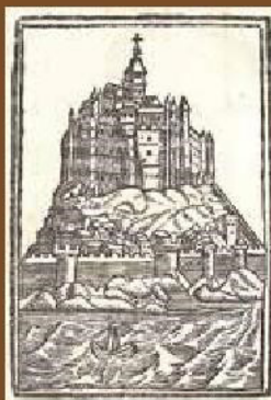
Le Mont, bois gravé, XVIII e siècle.