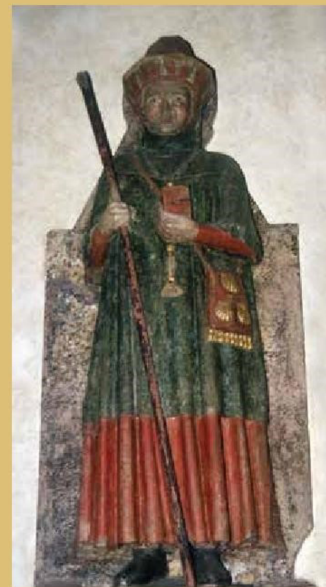
Tamerville (Manche), statue de saint Jacques en pèlerin, XV e siècle.