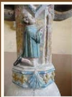
Pèlerin, croix polychrome, XV e siècle.